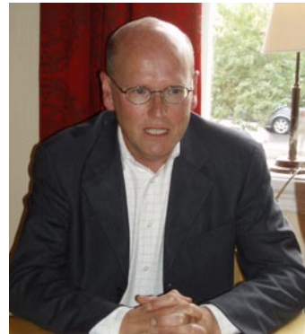
Thomas Östros (S), gästade KFH i augusti.

Tisdagen den 17 augusti 2010 gästade Thomas Östros KFH. Han är socialdemokraternas ekonomisk-politiska talesman och just nu ute på en turné i landet inför det stundande valet. Deltagare från ett trettio-tal företag passade på att lyssna till Östros och ställde kritiska frågor om framtiden, skatter och satsningar kring företagande.