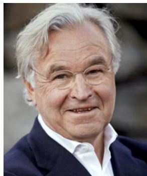
Sven Hagströmer, känd finansman och en av drakarna i Draknästet.

Näringslivsdagen i Karlskrona närmar sig och i skrivande stund är 96 utställare inbokade. Även i år äger Näringslivsdagen rum i tennishallen på Telenor Arena Karlskrona.