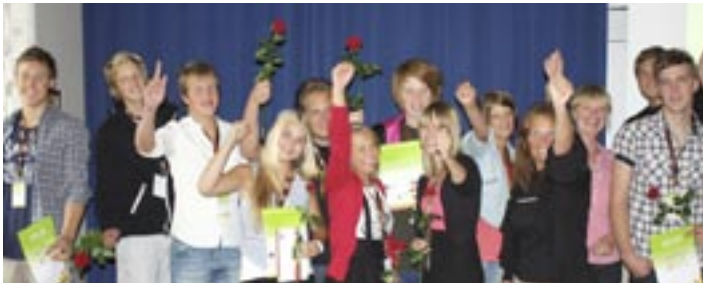
Här ses Blekinges unga entreprenörer tillsammans med representanter för Ung Företagsamhet. Firandet skedde i Företagarnas Hus i Karlskrona.