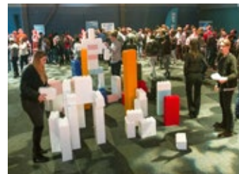
De studenter som besökte Exjobbmässan under fredagens eftermiddag fick bl.a. prova på att skapa i lego.