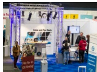
Rortex var ett av företagen som ingick i Industrigruppens gemensamma monter.