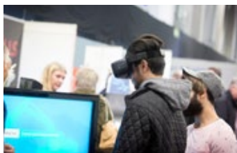
Spännande teknik visades upp på mässan och många intresserade provade på.