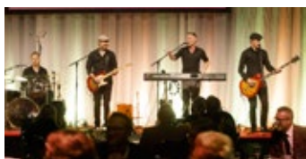
På Näringslivskvällen underhölls gästerna av coverbandet Stämbandet.