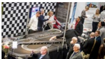
Mustasch Reklambyrå hade anordnat en biltävling i sin monter, där vinnare vann en pokal fylld med godisbilar.