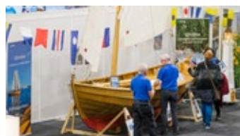
Litorina visade upp en vacker båt skapad av Båtbyggarlinjen.