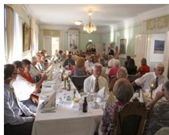
Vårdarnas afton i Företagarnas Hus.

arrangerat besök i den berömda mastkranen. Sedan var det middag och fest tillsammans med samtliga gäster under värdskap av Karlskrona