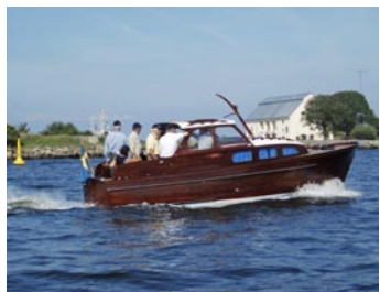
KFH:s gäster bjöds på skärgårdstur.

Gästerna fick uppleva Karlskrona när det är som bäst. Fredagen startades med en tur på havet i Nostalgiens redaktionsbåt där de fick se en del av Karlskronas skär-