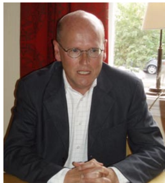
Thomas Östros (S), gästade KFH i augusti.

Tisdagen den 17 augusti 2010 gästade Thomas Östros KFH. Han är socialdemokraternas ekonomisk-politiska talesman och just nu ute på en turné i landet inför det stundande valet. Deltagare från ett trettio-tal företag passade på att lyssna till Östros och ställde kritiska frågor om framtiden, skatter och satsningar kring företagande.