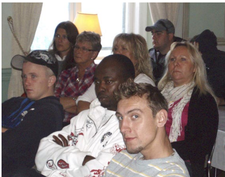
Deltagarna fick bl.a. information om vilken kompetens som krävs inom olika branscher.

Fikalösningar AB, Hoby Mur & Puts AB, Input Interiör KC, Kulturdoctorn, MopedCenter Sverige AB, Mrs Miller Arkitekter/Gyllensvärd AB, Pramwall trädgård & design, RH Städ & Specialgolv AB, Scandic Karlskrona, Tonkällan.